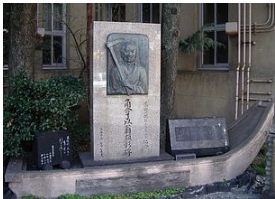
立誠小学校跡前にある角倉了以の顕彰碑 ~ 三条、四条間の木屋町通り沿い ~